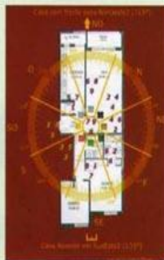
Mapa energético de uma habitação voltada a Noroeste com 315° na sua face

Imagine se o quarto do seu filho se situa na divisória em que se encontra a energia da irritabilidade. O que acontece é que as crianças tornam-se agressivas e